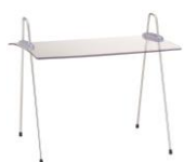
EB 700 E