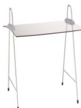
EB 707 E