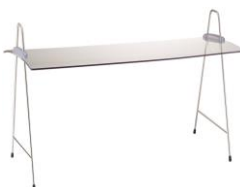
EB 710 E