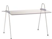
EB 701 E