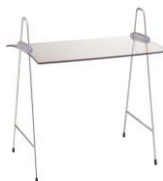
EB 708 E