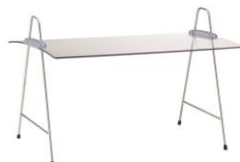
EB 709 E