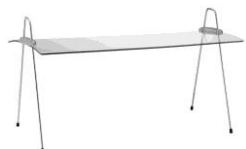
EB 702 E