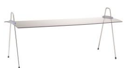
EB 703 E